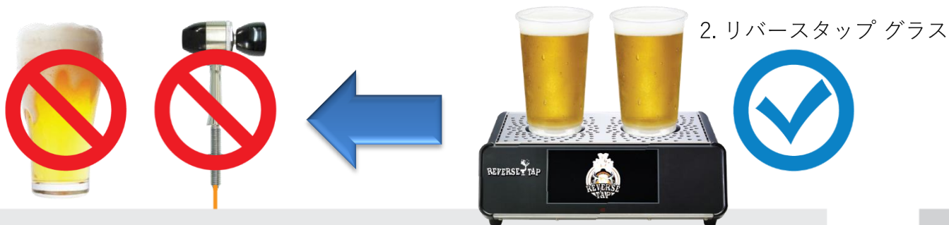
1. リバースタップ ディスペンサー

全体のシステムを取り替える必要がなく、ディスペンサーを取り替えるだけですぐ使用可能。