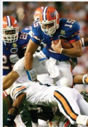
スポーツ・レジャー産業